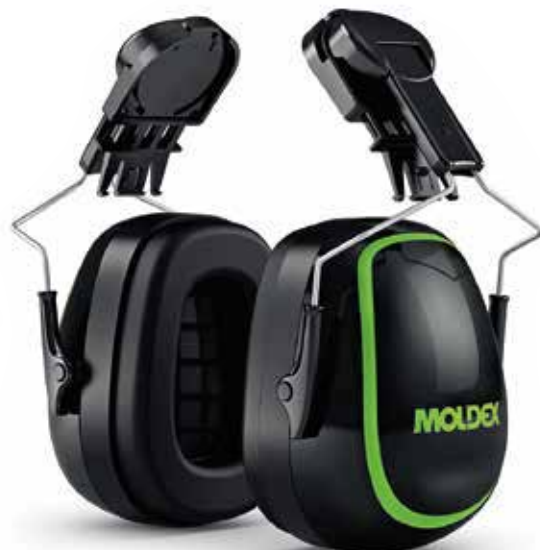
6140 MX-7 MONTABLE A CASCO